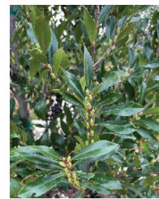
Prunus caroliniana 'Bright N' Tight' 'Bright N' Tight' Carolina Cherry Laurel Mature size: 8-10' H x 6-8' W

Moderate growing, compact and dense upright evergreen shrub. Thick, glossy green foliage is useful for creating a solid barrier or privacy screen . Adaptable to shearing, or may be trained as topiary.