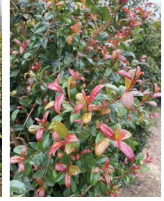
Eugenia myrtifolia, Syzygium paniculatum