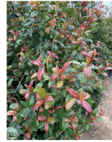
Eugenia myrtifolia , Syzygium paniculatum Australian Brush Cherry Mature size: 30-60' H x 10-20' W (unpruned)

Moderate growing and dense; useful for creating a dense hedge or screen . Can also be trained into topiary form. Best in full sun. Flowers bloom in early spring, followed by red berries that attract birds.