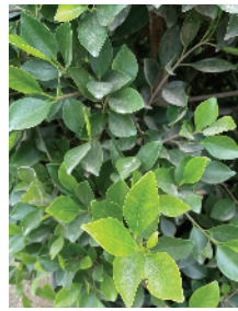
Ficus retusa nitida , F. macrocarpa Indian Laurel Fig, Chinese Banyan Mature size: 20-60' H x 20-60' W

Fast growing, tropical plant adaptable to pruning as a hedge, screen, or standard tree. Plant in full sun to part shade. Glossy, deep green foliage . One of the most popular selections for creating a quick screen.