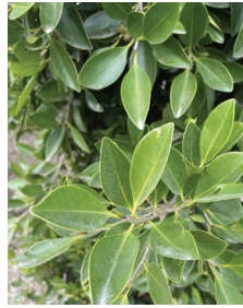
Ficus retusa nitida, F. macrocarpa