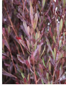
Dodonaea viscosa 'Purpurea'