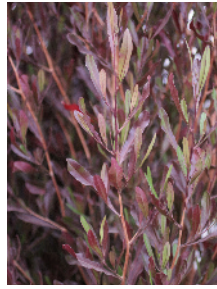
Dodonaea viscosa 'Purpurea' Purple Leaved Hopseed Bush Mature size: 10-15' H x 10-15' W

Fast grower, branches are easily pruned into a formal hedge or screen with electric hedgers. Best in full sun to light shade. Willow-like foliage is bronze-green and flushes red in cool weather. A dense and shrubby form makes this the best choice for a wind break .