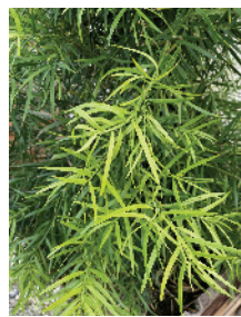
Podocarpus gracilior Fern Pine Mature size: 20-60' H x 10-20' W

Moderate to fast growing, tall hedge, low maintenance. Plant in full sun to part shade. Soft, gray-green, wispy foliage . Popular, very versatile and will tolerate a variety of watering conditions. Usually free of pests and diseases.